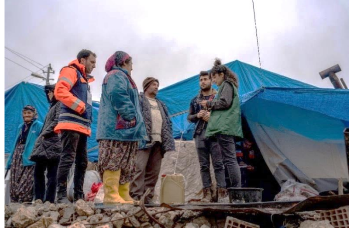
Concern Worldwide kuruluşunda çalışan insani yardım ekibi Adıyaman ilinde kırsal alanda yaşayan ailelere hijyen kiti ve diğer zaruri yardım ürünlerini dağıtıyor.