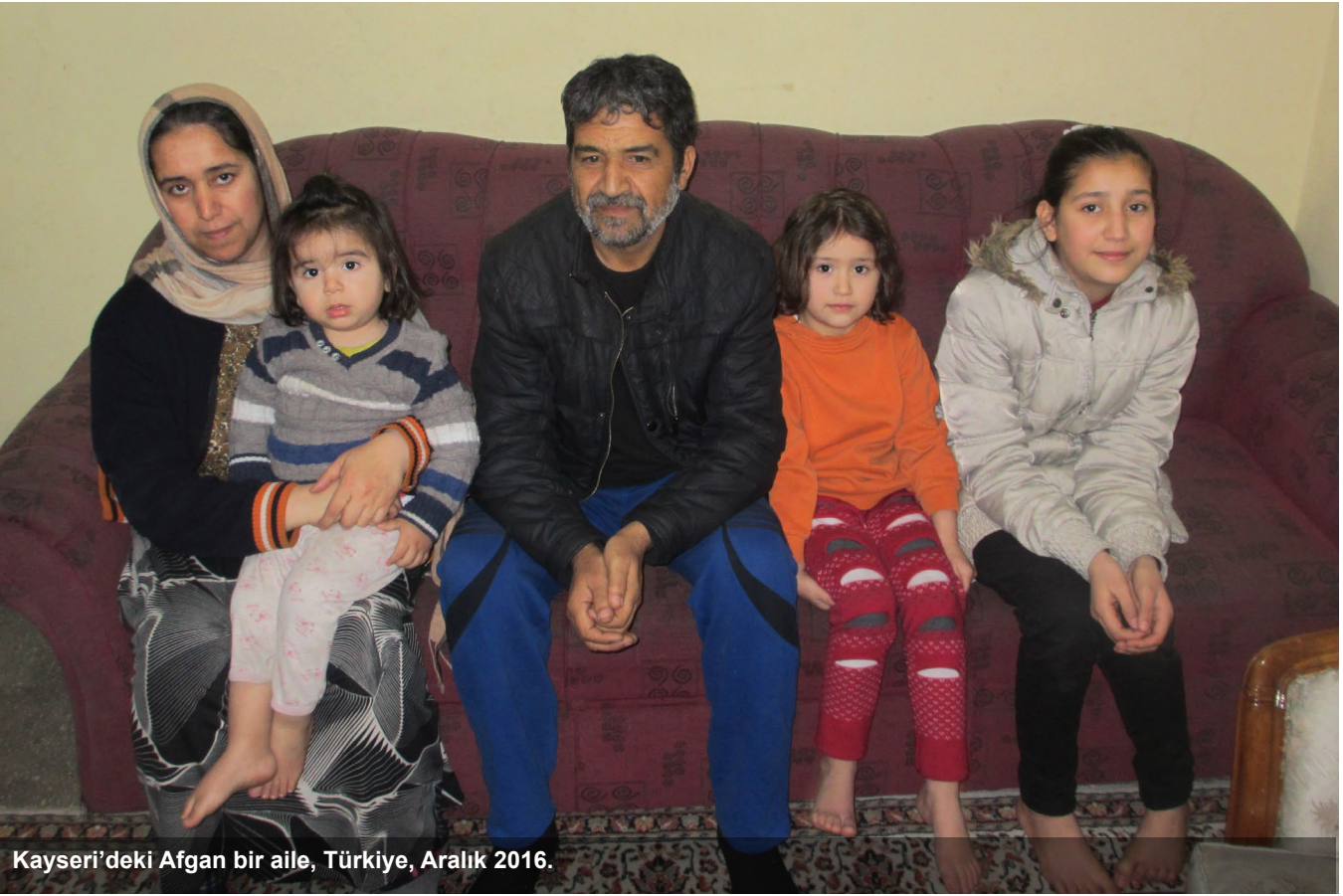
Kayseri'deki Afgan bir aile, Türkiye, Aralık 2016.

Suriye ve çok sayıda diğer ülkede yerinden edilmenin kökeninde yatan sebeplerin ele alınması için çok daha karmaşık ve uzun erimli jeopolitik bir çabayı gerektiriyor. Ancak öte yandan diğer iki kalıcı çözüm türünün kısa vadede desteklenmesi için yapılabilecekler ise oldukça fazla. Türkiye'deki mülteciler için ayrılan yeniden yerleştirme yeri sayısı genel itibarıyla ve özellikle de Suriyeli olmayan mülteciler için çok düşük bir düzeyde kalmaya devam ediyor. Dolayısıyla da üçüncü bir ülkeye yeniden yerleştirilme yeri sayılarının da, en azından artırılmasa bile, korunması gerekiyor.