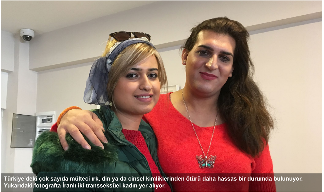
Türkiye'deki çok sayıda mülteci ırk, din ya da cinsel kimliklerinden ötürü daha hassas bir durumda bulunuyor. Yukarıdaki fotoğrafta İranlı iki transseksüel kadın yer alıyor.

ve sağlık hizmetlerine ulaşmadaki zorlukların yanı sıra, kendilerine yönelen ayrımcılıkla da karşı karşıyalar.