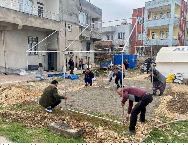
Adiyaman'da gayri resmi bir yerleşim yerinde kalan insanlar hasar gören evlerinin yakınında çadır kurmaya çalışıyor. Yerleşim yeri, su, sanitasyon ve hijyen gibi temel imkanlardan yoksun.

Türkiye'nin güneydoğusunda meydana gelen yıkıcı depremlerden sonra neredeyse altı hafta geçmesine rağmen, barınma, su, sanitasyon, hijyen, sağlık hizmetleri ve zaruri yardım malzemeleri gibi temel ihtiyaçlar halen sürüyor. Depremin etkileriyle mücadele eden Adiyaman ve Şanlıurfa'da meydana gelen sel felaketi ise geçici yerleşim yerlerinde kalan kişiler için çok zor olan koşulları daha da kötü hale getirdi.