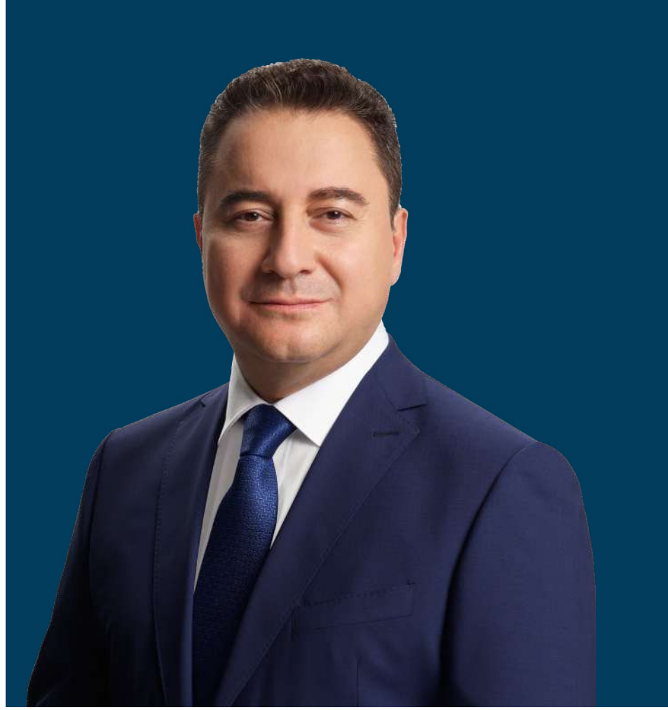
Ali Babacan DEVA Partisi Genel Başkanı

Türkiye, son on iki yılda Ortadoğu'daki, Afganistan'daki ve komşu ülkelerdeki savaşlara ve karmaşaya hazırlıksız yakalanmıştır. Ülkemiz bu süreçte çok büyük bir kitlesel akına ve düzensiz göçe maruz bırakılmıştır. Ayrıca, yine aynı dönemde, sınırlarımızdan Avrupa'ya geçiş yapmaya çalışan yüzbinlerce düzensiz göçmen sorunuyla karşı karşıya kalınmıştır. Çok daha fazla sayıda düzensiz göçmenin ise sınırlarımızdan kontrolsüz şekilde geçtiği tahmin edilmektedir.